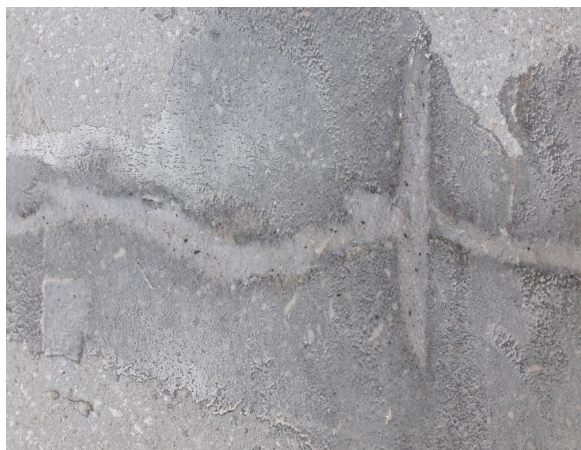
Sanirana konstruktivna pukotina