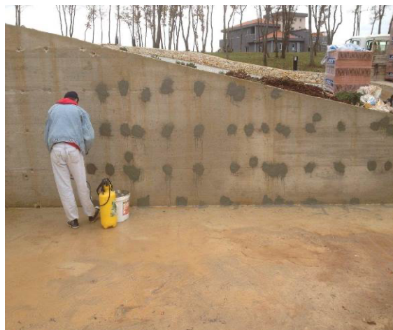
Zatvaranje rupa od distancera