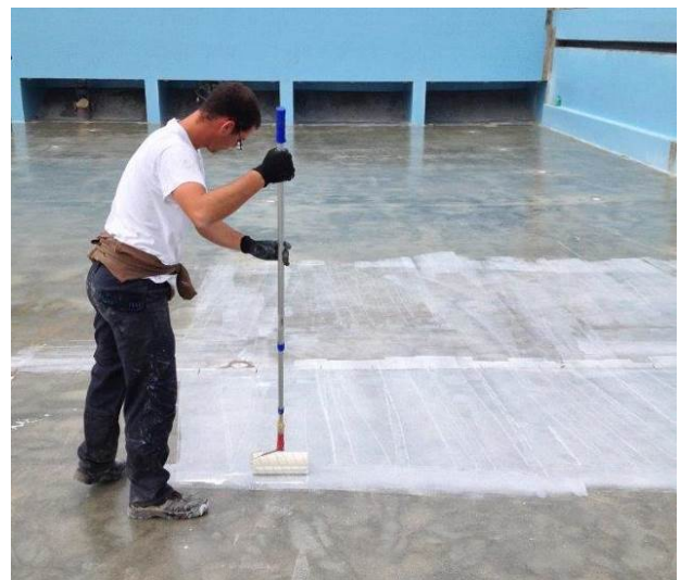
Nanošenja prajmera na podnu ploču