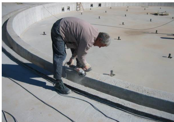
Brušenje preljevnog kanala