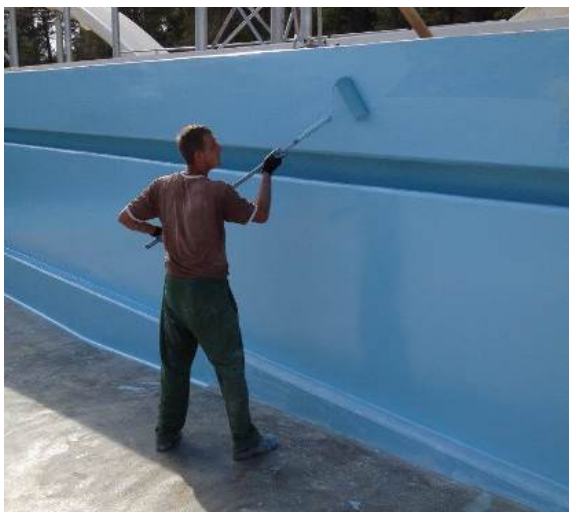
Nanošenje boje valjkom na zid

Završni sloj se izvodi od epoksidne boje DRACO® POOL 800 . Proizvod se nanosi kratkodlakim valjkom u dvije ruke. Druga ruka proizvoda se nanosi nakon sušenja prve ruke. Ukoliko se želi postići protukliznost površine u prvu ruku premaza se dodaje kvarcni pijesak čiji višak se odstranjuje nakon sušenja boje.