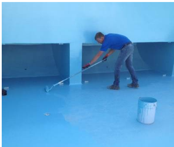
Nanošenje boje valjkom na pod