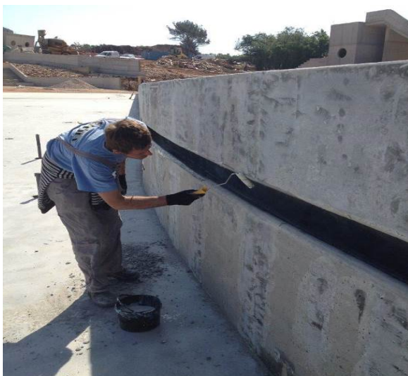
Nanošenje prajmera na zid

Prajmer se nanosi u jednom ili dva sloja, ovisno o poroznosti podloge. Svaki sloj prajmera se nanosi u razmaku od cca 24h.